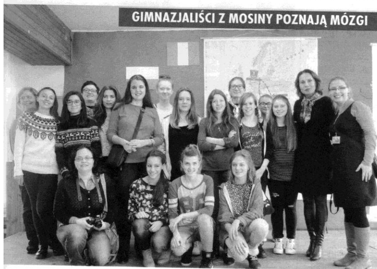
GIMNAZJALIŚCI Z MOSINY POZNAJĄ MÓZGI