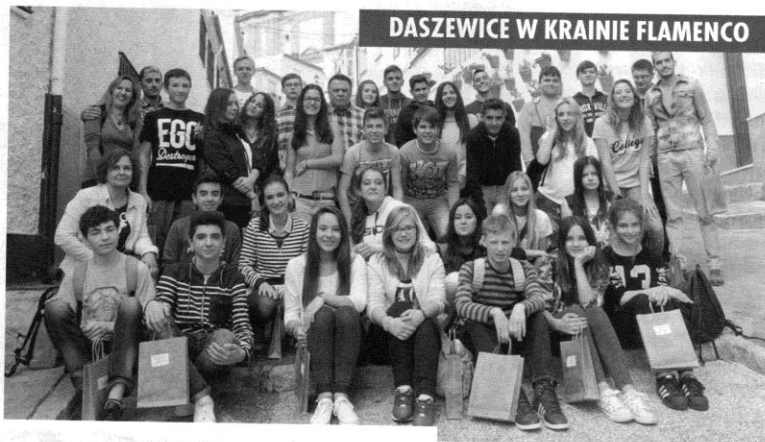
DASZEWICE W KRAINIE FLAMENCO

Polscy uczniowie mieszkali w domach swoich hiszpańskich kolegów i koleżanek, poznając ich kulturę, zwyczaje i tradycje.